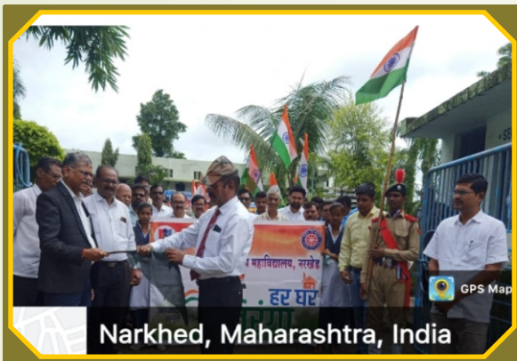
Narkhed, Maharashtra, India