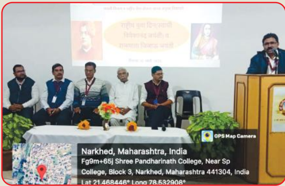
Narkhed, Maharashtra, India Fg9m+65j Shree Pandharinath College, Near Sp College, Block 3, Narkhed, Maharashtra 441304, India Lat 21.468446° Long 78.532908°