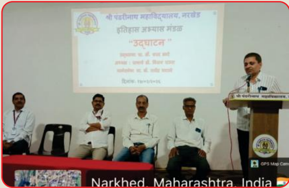
Narkhed, Maharashtra, India