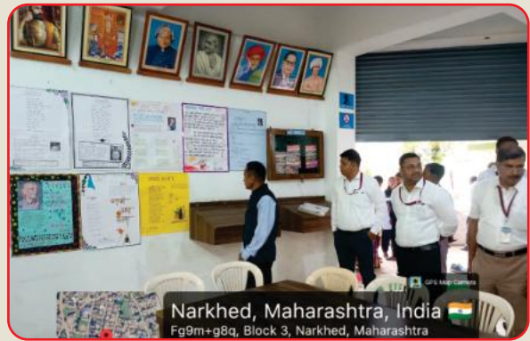
Narkhed, Maharashtra, India Fg9m+g8q, Block 3, Narkhed, Maharashtra