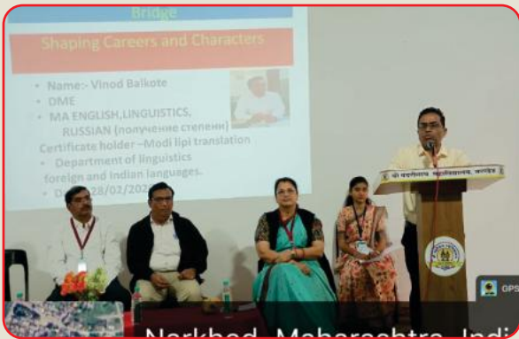
Narkhed, Maharashtra, India